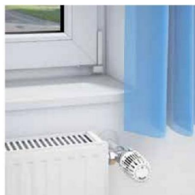
Frit tilgængelig føler